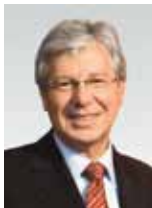
Jens Böhrnsen Bürgermeister

Präsident des Senats und Senator für Kultur